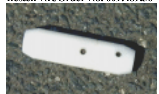
Kupplungswirbel / Coupling swivel Bestell-Nr./Order No. 009.485.00

Technische Änderungen vorbehalten. Specifications are subject to change without notice.