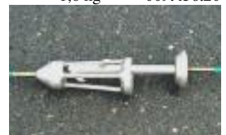
Fanggerät Coupler device Bestell-Nr./Order No. 009.489.30