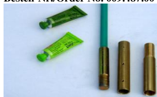
Anfangshülse / Starting bushing Band-Ø Rod dia. 6 mm 009.470.00 9 mm 009.484.00 11 mm 009.481.00