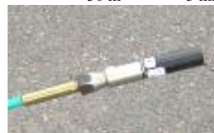
Adapter für Ortungs-sonde Coupling joint for transmitter Bestell-Nr./Order No. 009.479.00