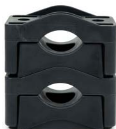
SEG Type 26 - 50