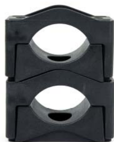
SEG Type 50 - 80