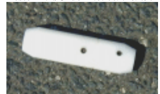
Kupplungswirbel / Coupling swivel Bestell-Nr./Order No. 009.485.00

Technische Änderungen vorbehalten. Specifications are subject to change without notice.