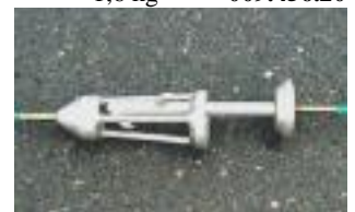
Fanggerät Coupler device Bestell-Nr./Order No. 009.489.30