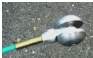
Anfangsrolle Starting roller Bestell-Nr./Order No. 009.487.00