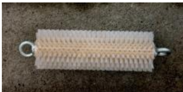
Kanalbürste mit Kunststoffborsten Duct brush with plastic bristles