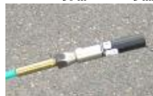
Adapter für Ortungs-sonde Coupling joint for transmitter Bestell-Nr./Order No. 009.479.00