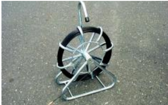
Kunststoff-Einschiebeband in verzinkter Stahlhaspel, stehende Ausführung, kompl. mit Anfangs- und Endhülse sowie Anfangsbirne Glass fibre rod spooled in a galvanized cage, standing design, completed by starting / ending junctions, spinner