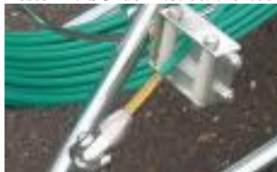
Abrollkassette für Haspel Roller device for cage Bestell-Nr./Order No. 009.477.00