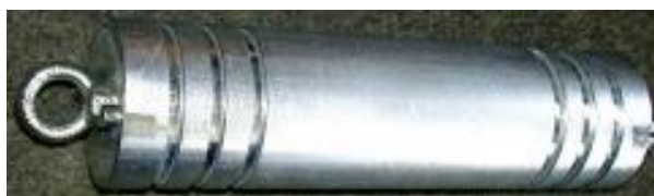
Röhrenfeile Pipe file