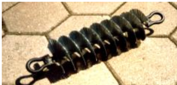
Kanalbürste mit Stahldrahtborsten und Linksdrall Duct brush with steel bristles and left spiralled