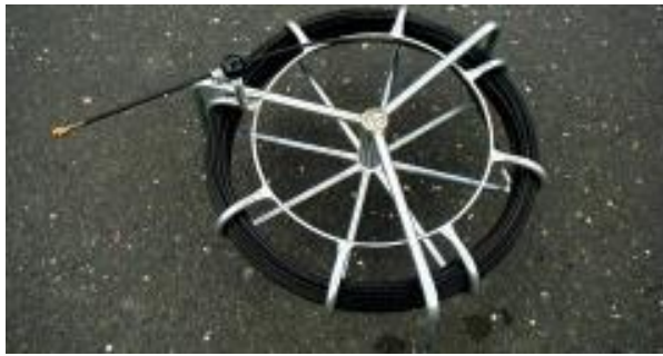
Kunststoff-Einschiebeband in verzinkter Stahlhaspel, liegende Ausführung, kompl. mit Anfangs- und Endhülse sowie Anfangsbirne Glass fibre rod spooled in a galvanized horizontal cage, completed by starting / ending junctions, spinner