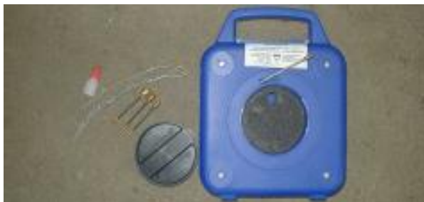
Kunststoff-Einschiebeband „Mini-Flex“ Kassette, kompl. mit Ziehstrümpfen, Anfangs- und Endhülsen, Verbindungshülse, Kleber Glass fibre rod „Mini-Flex“, completed by container, flexible grips, spinner, starting junctions, pliers and glue