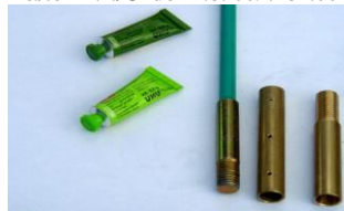
Anfangshülse / Starting bushing Band-Ø Rod dia. Bestell-Nr. Order No. 6 mm 009.470.00 9 mm 009.484.00 11 mm 009.481.00