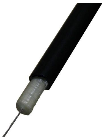
Kunststoffeinschiebeband mit Kupferlitze Glass fibre rod with a strand of copper